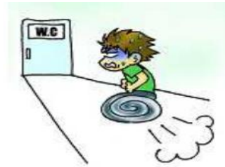
อุจจาระร่วง