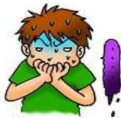
คลื่นไส้และอาเจียน

Q2 เมื่อมีการติดเชื้อไวรัสโนโลจะมีอาการเช่นใด?